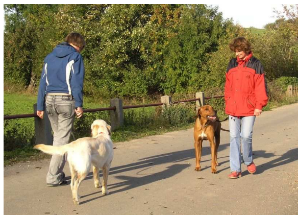
Při setkání s jiným psem navrhuji využít pozitivní motivaci a upoutat pozornost svého psa na sebe.

Pamatujte, že nevyhrává ten, kdo projde okolo cizího psa držíc toho svého „aby nemohl“ a nic se nestane. Vítězem se stáváte teprve ve chvíli, kdy okolo rušivého elementu projde váš pes s klidem Angličana na prověřeném vodítku . Tomu říkáme důslednost. Co na tom, že to chvíli trvalo, věřte že ta ztráta času vám za to stojí. V očích vašeho svěřence máte bod k dobru a příště již složitou situaci zvládnete o něco rychleji. Nebojte se požádat o pomoc ostatní pejskaře, většina z nich bude mít určitě pochopení, a vaši snahu o to mít psa vychovaného oceníme všichni.