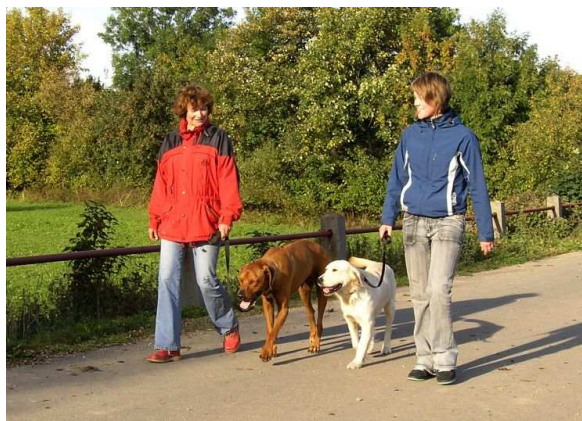
Budete-li důslední, výsledek se brzy dostaví.